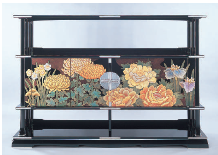
上から《菊文蒔絵沈金懸盤》(1990)、《日月四季花鳥蒔絵色紙箱》(2003) 《蘇東坡沈金雲板》(1957, 部分)、《四季草花蒔絵沈金棚》(2003)